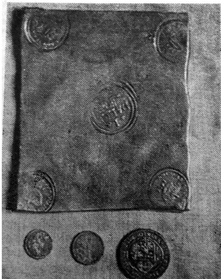
Nuotraukoje – 17-ojo šimtmečio švedų moneta, saugoma Klaipėdos kraštotyros muziejuje. Apačioje – įprasto dydžio monetos.