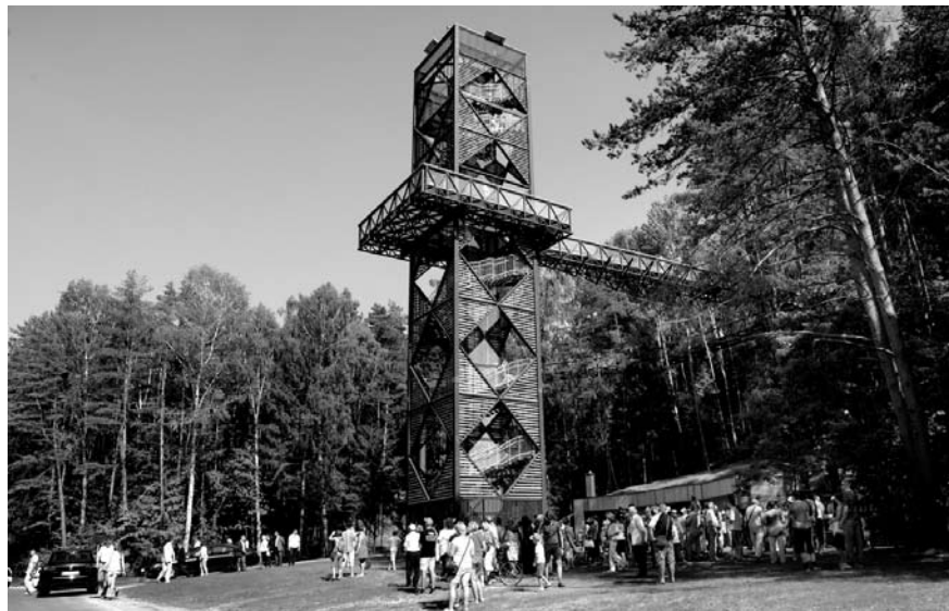
Nuo rugpjūčio 7-osios Medžių lajų take Anykščiuose kviečiami apsilankyti visi norintieji.

Lajų takas lankytojams bus atviras kiekvieną dieną nuo 10 iki 19 valandos.