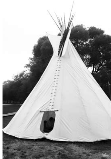
Prie Šventosios stovintis „Teku Taku“ indėniškas tipis buria įvairių pomėgių žmones.

Kaip ir uogautojams, taip ir grybautojams yra tam tikros baudos už netinkamą grybavimą. „Netinkamas grybavimas – tai per mažų grybų rinkimas, taip pat – kai nevalgomus grybus išspardo. Tokių „spardytojų“ anksčiau nemažai būdavo, šiuo metu pažeidėjų mažėja. Pažeidėjams gresia baudos nuo 7 eurų“, – sakė A. Kazakevičius.