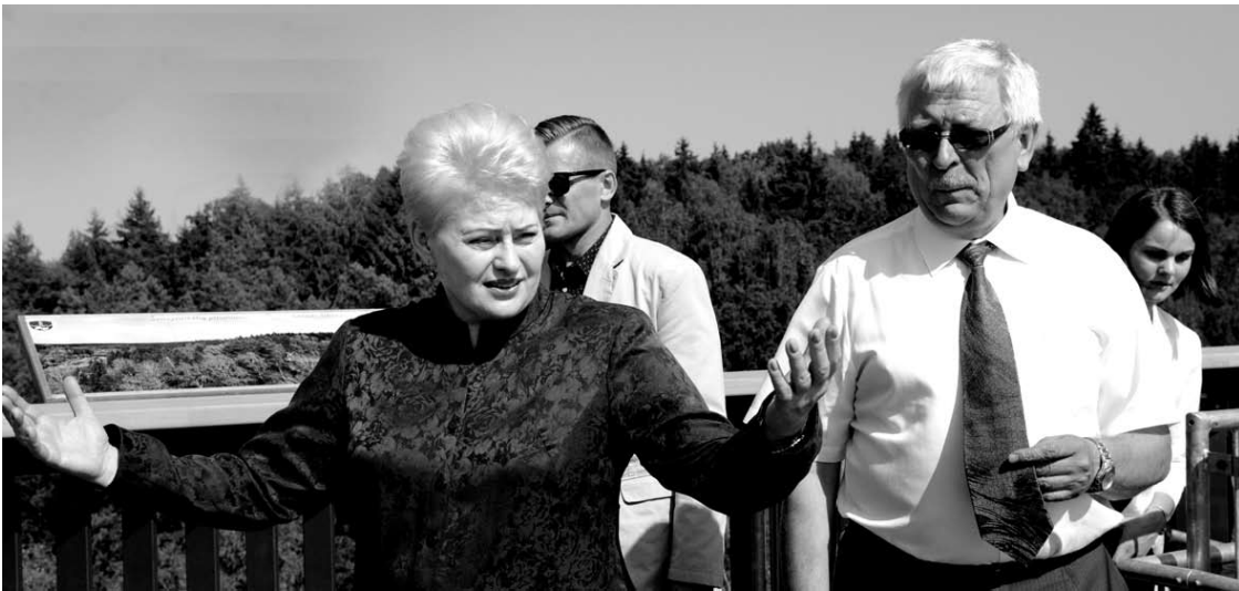
Iš bokšto viršūnės Prezidentė grožėjosi atsivėrusia Anykščių šilelio panorama.