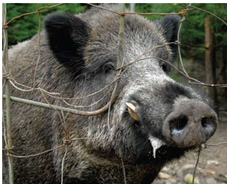
Šernai afrikinį kiaulių marą atnešė ir į Anykščių rajoną.

Vidmantas ŠMIGELSKAS vidmantas.s@anyksta.lt